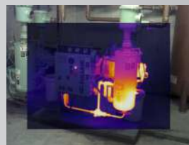
Imagen en imagen