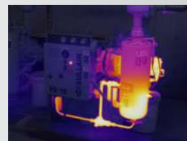
75 % de combinación